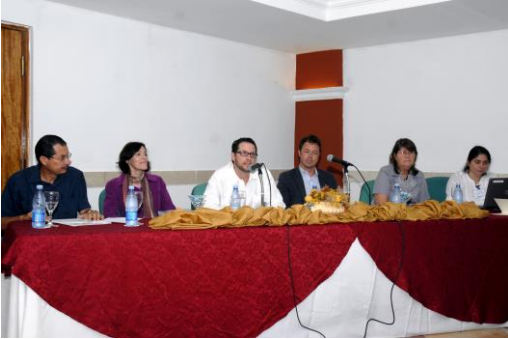
Panel de apertura: Embajada Canadá, CEDL y PNUD

Anexo1: Evidencias del Taller Metodologías y herramientas para la planificación estratégica local.