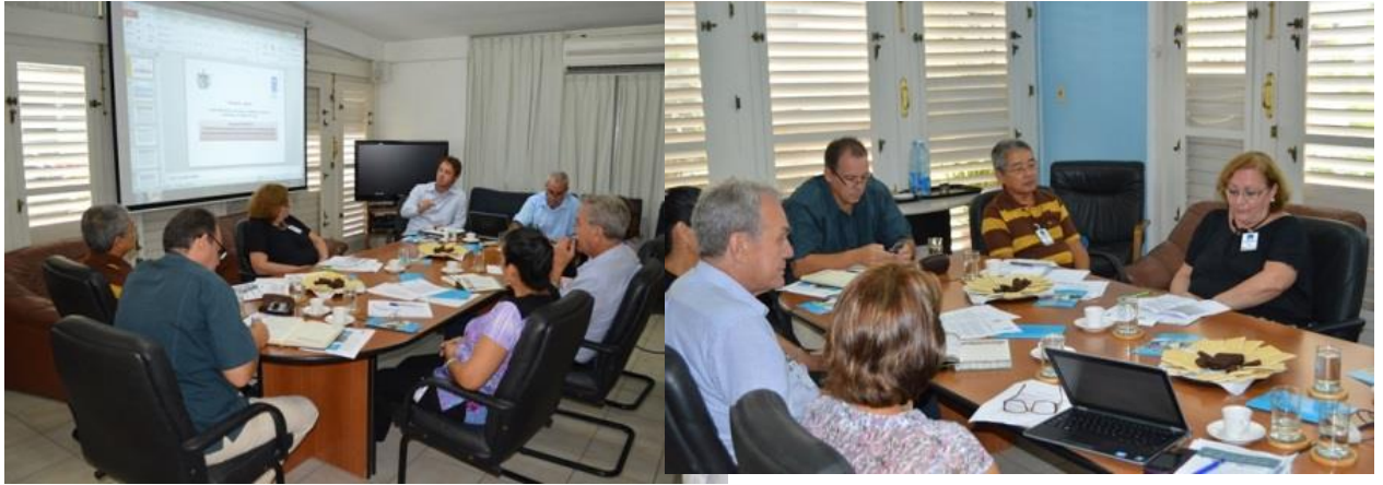
Imágenes del momento de Constitución del Comité Nacional de Coordinación CNC-PADIT: