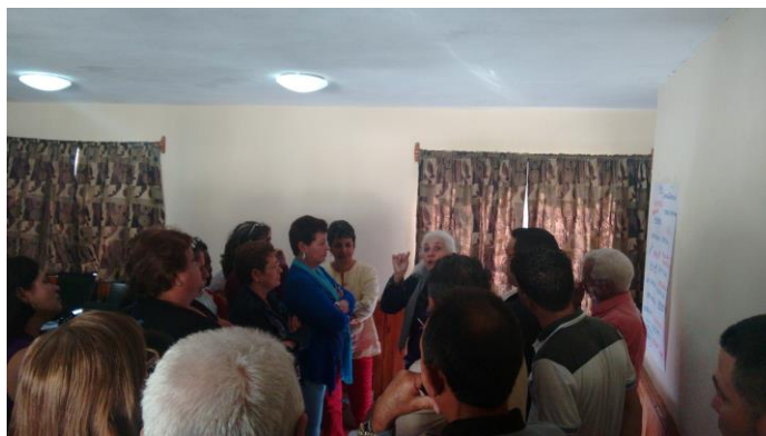
7.5- Taller el 25 y 26 de febrero 2015 sobre la Gestión de Información Geográfica y Catastral del Gobierno de Artemisa.